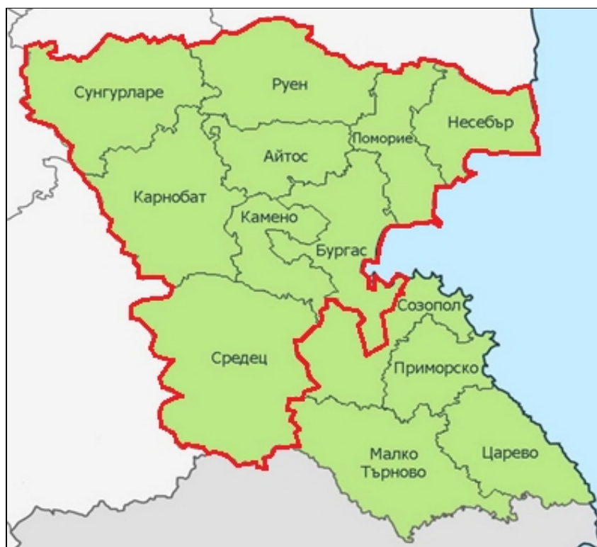
Фиг. 2. Административна карта на област Бургас с означен обхват на регион за управление на отпадъците Бургас

Община Несебър участва в Регионално сдружение за управление на отпадъците - Регион Бургас заедно с общини Бургас, Айтос, Камено, Карнобат, Несебър, Поморие, Руен и Сунгурларе. Основната цел на сдружението е изграждане на устойчива система за управление на отпадъците, която да осигурява необходимата инфраструктура за третиране, оползотворяване и екологосъобразното обезвреждане на битови в т. ч. биоразградими, опасни отпадъци от домакинствата и строителни отпадъци, генерирани на територията на региона.