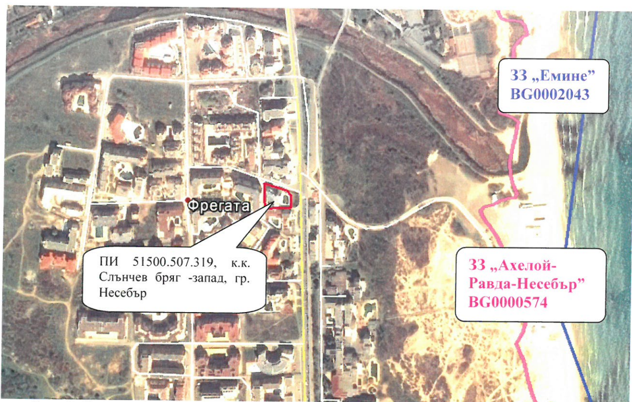
Фиг. 2. Сателитна снимка на района с отбелязано местоположението на имотът, предмет на инвестиционното предложение

• обекти, подлежащи на здравна защита – имотът, в който предстои да бъде реализирано инвестиционното предложение е урбанизиран, намиращ се границите на к.к. Слънчев бряг - запад, гр. Несебър. Обектите подлежащи на здравна защита са разположените в съседство хотели. Новопредвидения обект е с обслужващо предназначение към съществуващ хотел „Регата“ и не представлява източник на вредности в околната среда. Характерът на обекта не предполага въздействия, които биха повлияли неблагоприятно на обитателите на района. В момента не съществуват и с новото инвестиционно предложение не се предвиждат дейности и обекти, които биха представлявали рисков фактор за увреждане здравето на хората. Всички очаквани емисии на замърсители ще са в рамките на нормите за опазване на човешкото здраве. На практика източници на емисии във въздуха при експлоатация няма. Предвижда се организирано екологосъобразно третиране на отпадъчните води. Шумовите характеристики на района ще са в рамките на допустимите. Третирането на отпадъците ще става в съответствие с добрата практика в Община Несебър и по реда на ЗУО.