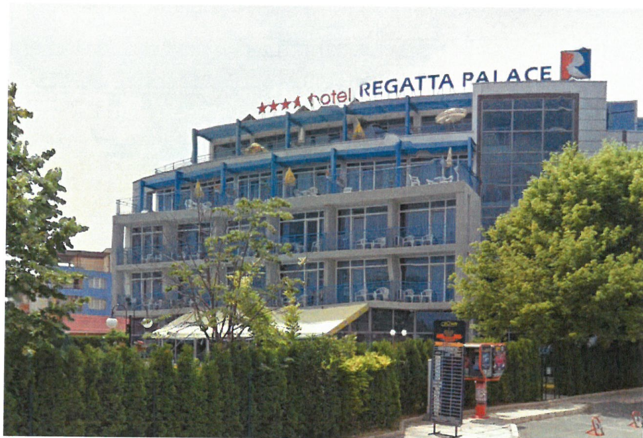
Фиг. 1. Снимка на съществуващия хотел „Регата”, к.к. Слънчев бряг - запад